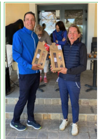
4 ème Net