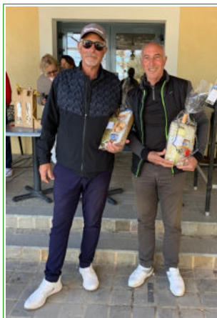
2 ème Net