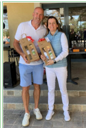
3 ème Net