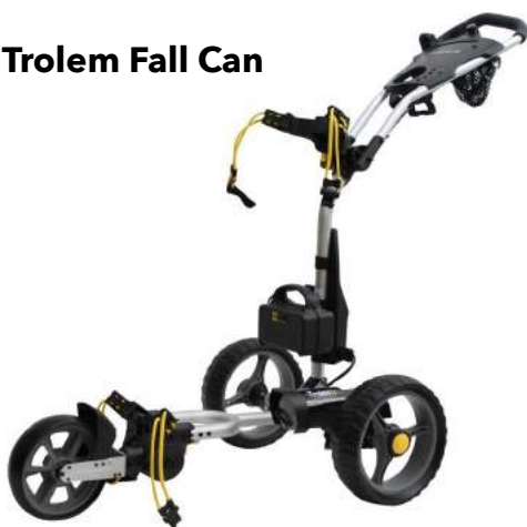
Trolem Fall Can