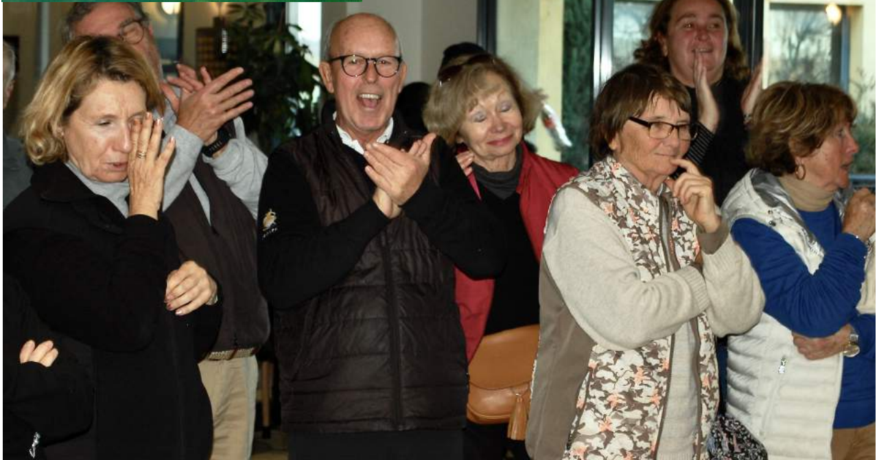
Quelques photos souvenirs de cette journée conviviale !