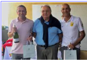
Quelques photos des récompensés.