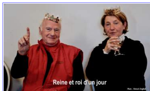
Reine et roi d'un jour

A l'issue de la remise des prix, un tirage au sort original ( c'est la fève ou le sujet trouvé dans les parts de gâteaux!) a donné lieu à une distribution de balles.