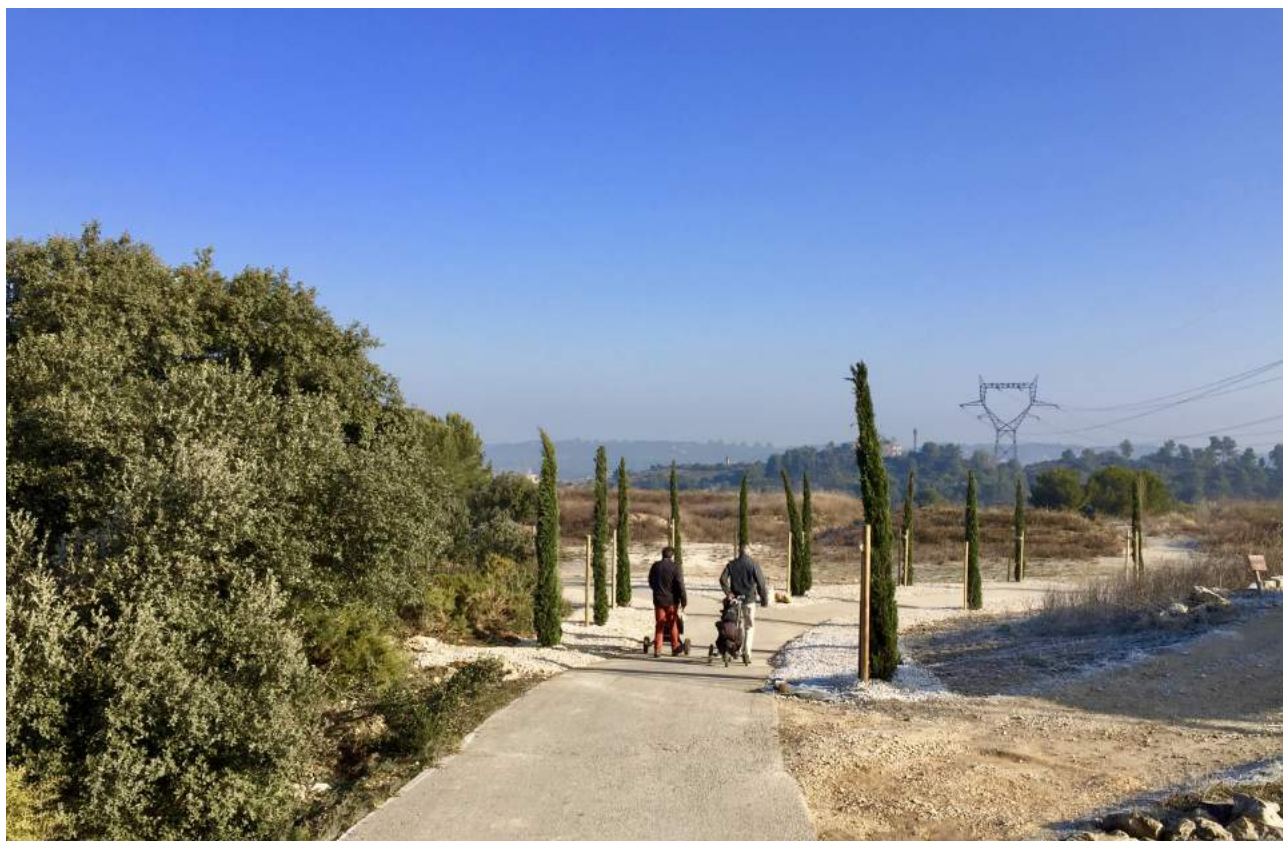
L'allée nouvelle vers le départ du 1

Le début d'année est également le moment de parer de nouveaux atours notre terrain de jeu: un panneau de bienvenue, un panneau général, des horloges, une nouvelle signalétique des trous devraient être livrés d'ici un mois. Le parcours sera fin prêt pour le printemps, ce qui coïncidera à la réouverture du Restaurant du golf, tenu par deux nouveaux gérants, golfeurs et passionnés par leur métier. Réservez leur le meilleur accueil et souhaitons leur succès et plein épanouissement au sein de notre club!